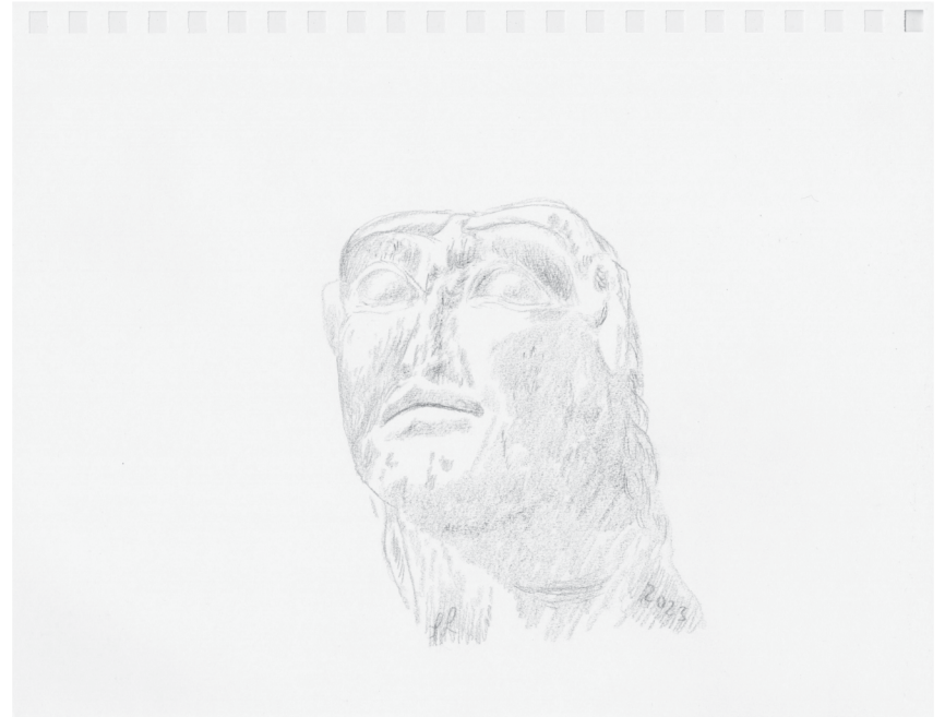
Stefan Lausch: Besuch bei den Ahnen, Buntstift-schwarz, 23x29,7cm