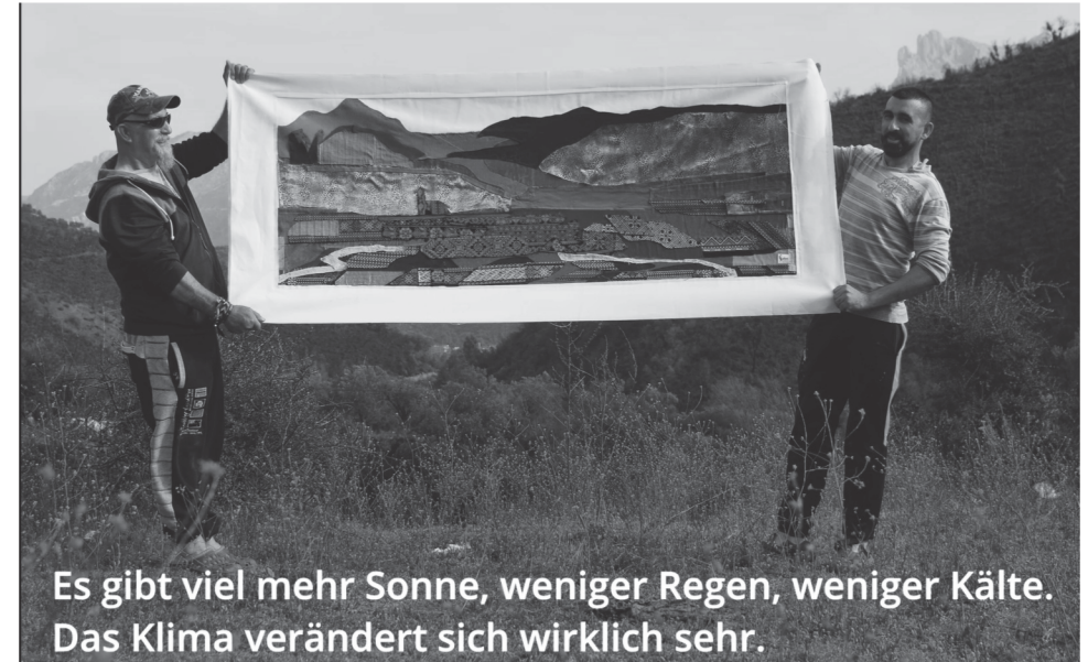
Stimmen aus Algerien

Der Vortrag ermöglicht Einblicke und kritischen Auseinandersetzung in die Struktur und den Entstehungsprozess des Projekts „Who the Freedom“ und eröffnet einen Diskurs zu theatralen Methoden als experimentelle Lehrmethode im Produktdesign, die das Erlernen von 21st-Century-Skills fördert.